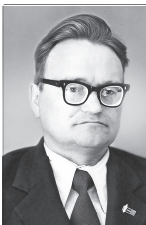
М.П. Авдеев район хаҗатәнчә чылай җул пай ертүсүнчә есләнә.

Майн 5-мәшәнчә Муркаш район хаҗачә 70 җул тултарчә. Хаҗатан пәрремәш номерә майн 5-мәшәнчә «Колхозник сасси» ятпа пичетленнә. Эрнере вәл пәр хуҗачән 1200 экзәмплярпа тухса тәнә. Пәрремәш редакторә Ф. Малышкин пулнә.